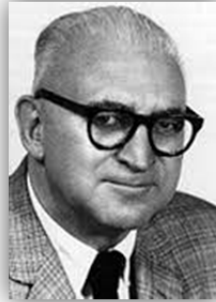
هارولد لاسول (۱۹۰۲-۱۹۷۸)